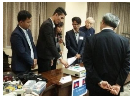
カンボジアチームの実演を鋭い眼差しで見る専門家