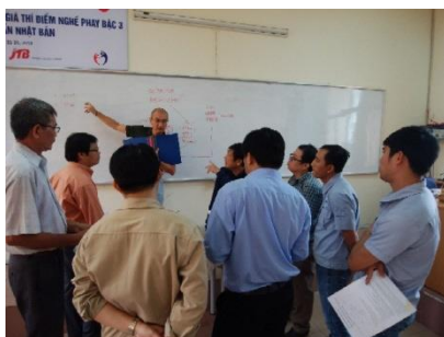
評価者講習の様子