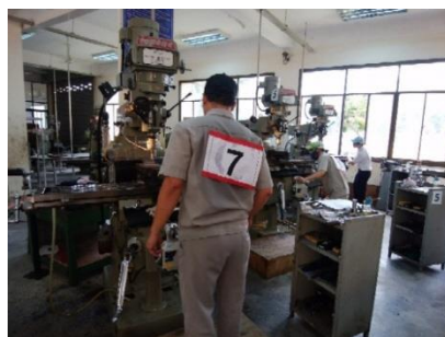
トライアル（実技試験）の様子